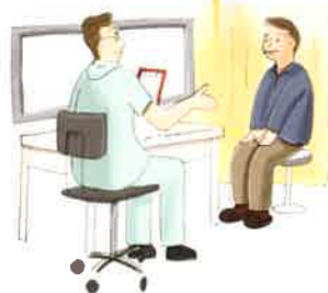
検査に先がけて診察を行います。