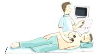
心臓に超音波を当てて、心臓の動きや弁の動きを調べます。