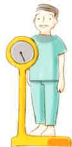
身長・体重、血圧等を測定します。