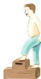
踏み段昇降後に心電図をとり、心筋虚血を診断します。