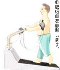
運動しながら心電図をとり、心筋虚血を診断します。