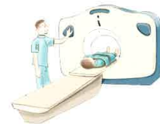
造影剤を注入し冠動脈を撮影し、狭窄や動脈硬化を診断します。

「急いで歩くと胸が苦しくなる。」「横になると息苦しくなり、よく眠れない。」といった症状を感じたことはありませんか？これらの症状は、狭心症や心不全の可能性がります。一般の検診や人間ドックでは、このような心臓の病気はなかなか発見できません。心臓ドックは、心臓病、特に無症状の狭心症、心筋梗塞・心臓肥大等を発見することを目的としています。狭心症や心筋梗塞などの虚血性心疾患は、年々増加傾向にあります。突然死の原因の一つである、虚血性心疾患は冠動脈の動脈硬化によって起こります。喫煙や肥満などの誤った生活習慣、高血圧・糖尿病・脂血症などの生活習慣病により、冠動脈の動脈硬化は進展し狭心症を悪化させる一方、心筋梗塞や心不全を引き起こします。このような、虚血性心疾患に対しては、内服治療のみならず、早期にカテーテル治療（風船治療）が必要です。当院の心臓ドックでは、運動負荷心電図検査や心エコー検査を実施することでこれらの心筋虚血のサインを見逃さず、さらに、最新鋭の64列マルチスライスCT検査で冠動脈の造影検査を行うことで、冠動脈の狭窄や動脈硬化の進行度を直接みることができます。症状のある方はもちろんのこと、症状がなくてもメタボリックシンドロームが認められる方は、是非、心臓ドックをご利用下さい。