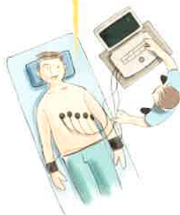
安静時の心電図をとります。